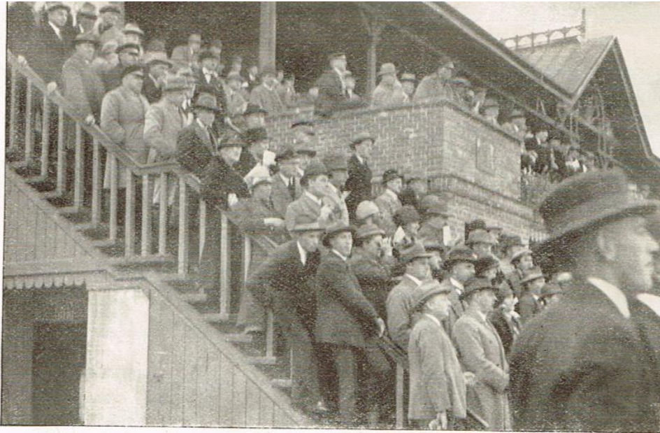
En af de meget efterstræbte Trapper, hvor Opholdet tilsyneladende er meget behageligt for Travpublikummet.

Trappen på den store tribune var et godt sted at få overblik fra