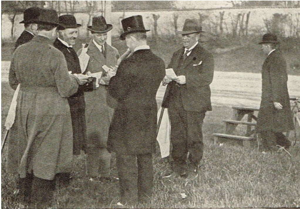
Overstarteren med Hjælpere, der havde deres Andel i Derbyets udmærkede Forløb.