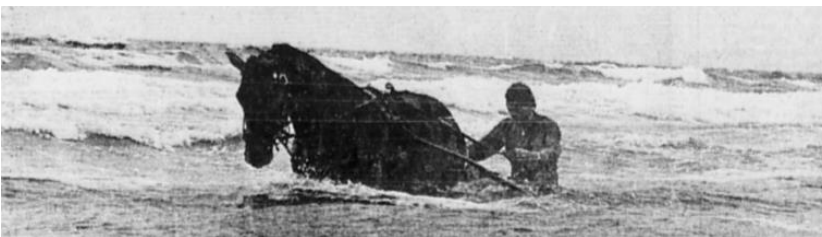
Så tog også Preben Kjærsgaard en dukkert, før Handybus og Kjærsgaard travede på den plane strand om kap med en surfer i havet.