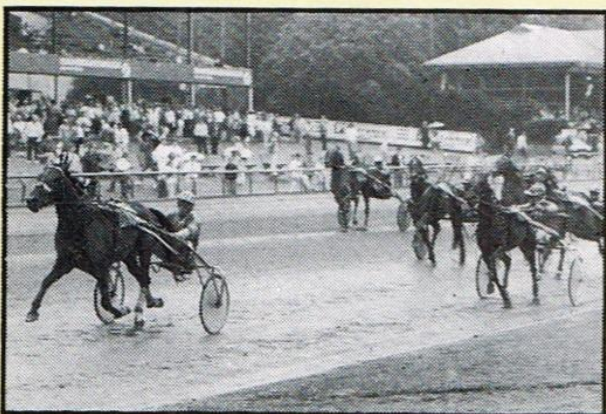
Årgangens mest vindende, Handybus var i sommerens løb plaget af en virus-sygdom, men vendte tilbage med sejr i Derbyprøven II for Preben Kjærsgaard. Trods galop kort efter start sejrede Handybus sikkert, og beholdt dermed favoritværdigheden til Derbyet.