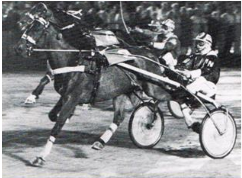
Handybus var storfavorit i Grand Circle 4 års Championatet, der blev afviklet i Skive, men ret overraskende måtte den se sig slået af Halifax Nyhave med Max Nielsen, der sejrede efter føring fra start til mål. Halifax Nyhave lavede hverken for eller siden en lignende præstation.

Der var så stor respekt for årgangens stjerner, at kun syv havde meldt til start i Grand Circle, mens 10 valgte trøstløb.